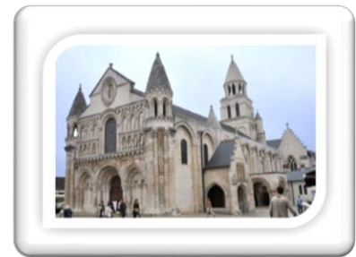
Notre Dame le Grande

Poitiers constitue le chef-lieu du département de la Vienne. Cette ville était aussi la capitale régionale de l'Ex-Poitou-Charentes. Cette position régionale importante fut permise par une importante empreinte historique. En guise d'exemple, nous pouvons citer Sainte Radegonde qui créa à Poitiers au VI ème siècle la première abbaye française exclusivement féminine. Par ailleurs la ville est nommée « ville aux cent clochers » pour ses nombreuses églises. Nous vous invitons à prendre du plaisir et à flâner dans les rues et ruelles du vieux Poitiers où vous attendent de nombreuses surprises architecturales et historiques.